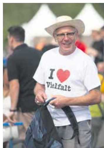
Diese Sportveranstaltung zeigt, dass Inklusion funktioniert.

Wer sich selbst bewegen möchte, kann sich weiterhin anmelden – es gibt noch freie Startplätze. Teilnehmende können ihre Unterlagen vorab in der SoVD-Bundesgeschäftsstelle abholen. Bei einer Anmeldung