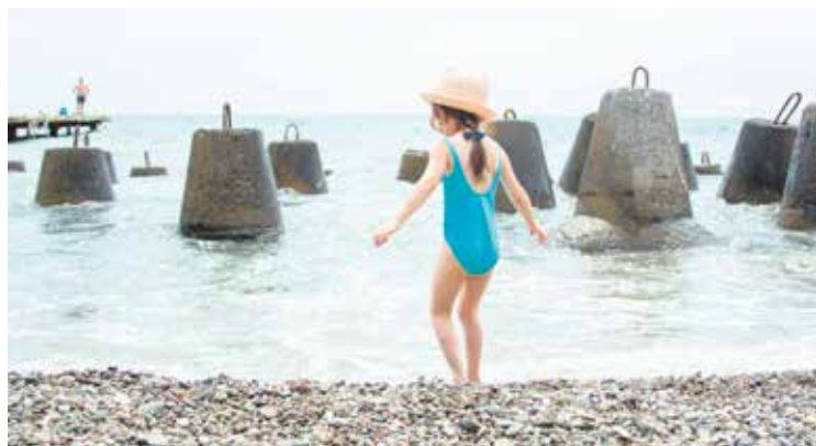
Grafik: Артем Барынин / Adobe Stock

Die DLRG bietet Schwimmkurse an und sucht immer ehrenamtliche Rettungsschwimmer*innen. Quelle: bg, DLRG