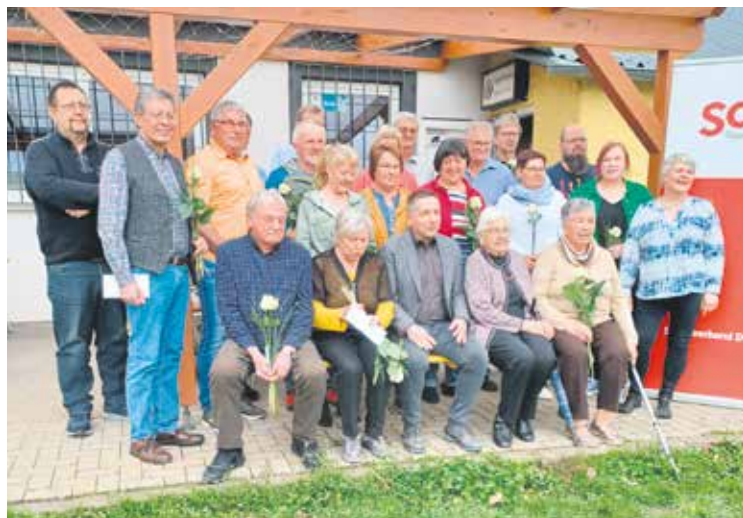
Alle Jubilar*innen stellten sich zum Gruppenfoto auf.

Langjährige Mitglieder in Lautertal geehrt