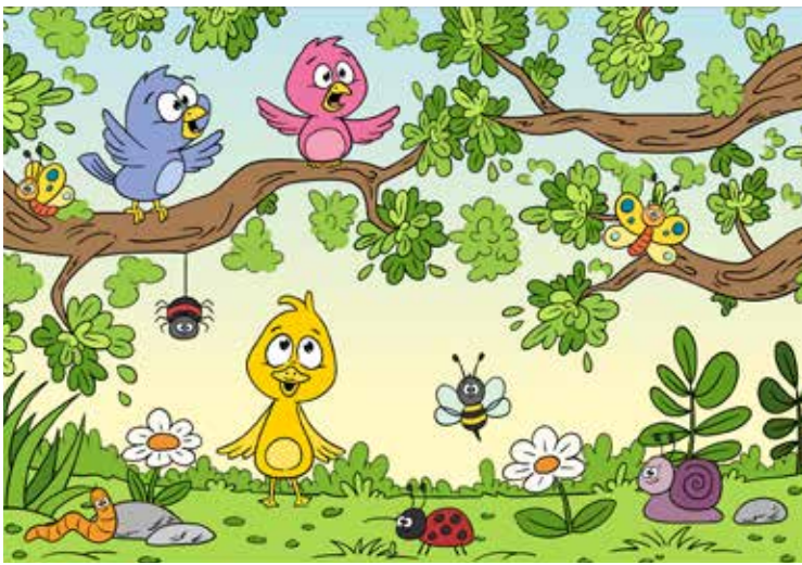
Grafik: GabiWolf / Adobe Stock

Auf dieser Lichtung ist einiges los! Doch auf dem unteren Bild haben sich insgesamt zehn Fehler eingeschlichen – kannst du sie alle entdecken? Falls nicht, blättere einmal um: Auf Seite 18 haben wir die Unterschiede rot eingekreist.