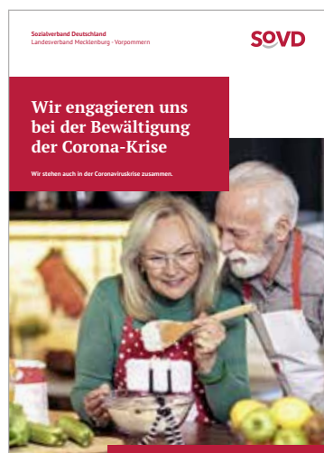
Die Aktionsbroschüre zur Krise.

Auch warten Tipps für die seelische Gesundheit und viele Infos zum Coronavirus. Ein Anhang enthält Musteranschreiben für verschiedenste Anlässe, Vorlagen und einen Gesprächsleitfaden für „Wohlfühlrufe“. Die 40-seitige Broschüre kann man im Internet als PDF-Datei direkt über die Startseite von www.sovd-mv.de herunterladen.