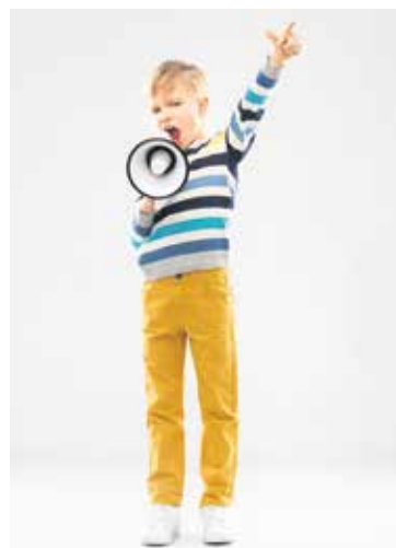
Auch der SoVD fordert: Kinderrechte ins Grundgesetz!

Fast 30 Jahre nach Inkrafttreten der Kinderrechtskonvention der Vereinten Nationen ist es höchste Zeit, Kinderrechte in das deutsche Grundgesetz aufzunehmen. Bis heute werden die Belange und Rechte von Kindern und Jugendlichen bei Entscheidungen in Politik, Verwaltung und Rechtsprechung nicht ausreichend berücksichtigt. Das Bündnis „Kinderrechte ins Grundgesetz“ fordert daher die Bundestagsfraktionen und die Bundesländer zum Handeln auf.