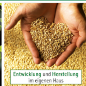
Entwicklung und Herstellung im eigenen Haus