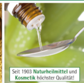
Seit 1903 Naturheilmittel und Kosmetik höchster Qualität!