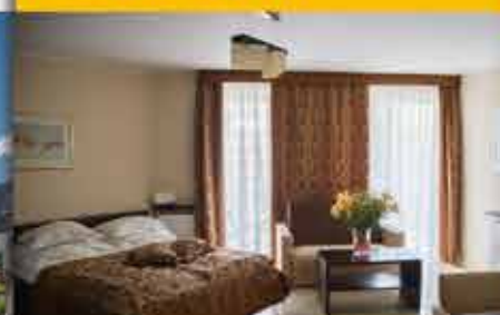
Zimmerbeispiel, 3★ Hotel Avangard Resort