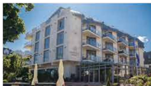
3★ Hotel Avangard Resort